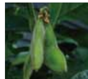
そして実がなります！