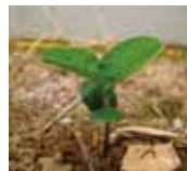
本葉が育ってきた！